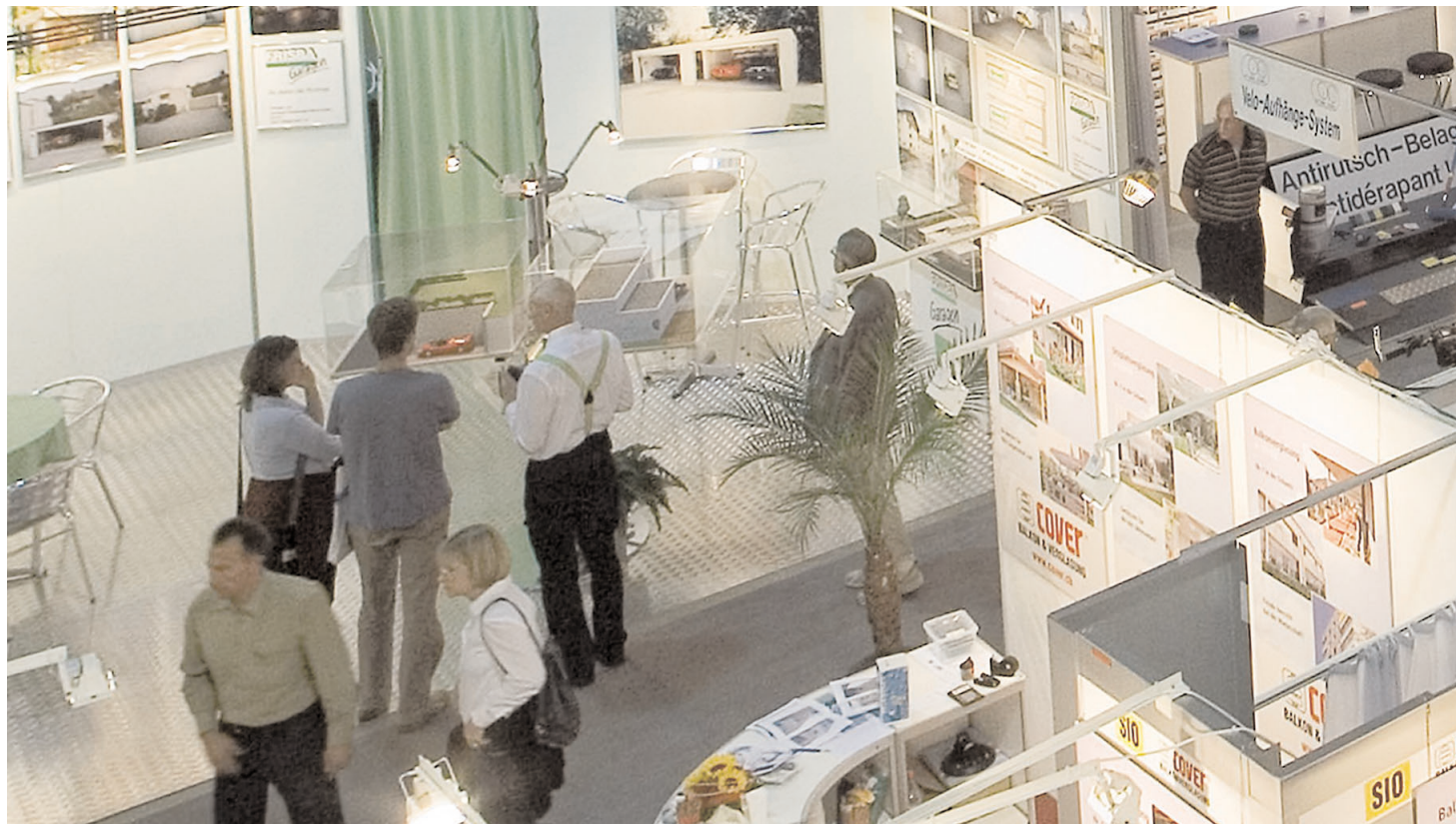
Die Messe «Bauen und Modernisieren» richtet sich an Haus- und Eigentumswohnungsbesitzer und weiteres Fachpublikum.

Rund 600 nationale und internationale Aussteller präsentieren auf einer Gesamtfläche von 30'000 m 2 in allen sieben Messehallen neueste Trends und Produkteinnovationen. Der Fokus richtet sich dabei auf energieeffiziente Bauweisen und zudem auf alles, was dem Komfort, dem «Sichwohlfühlen» in den eigenen vier Wänden dient.